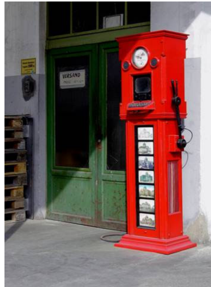
Ruhmstation nach Fertigstellung