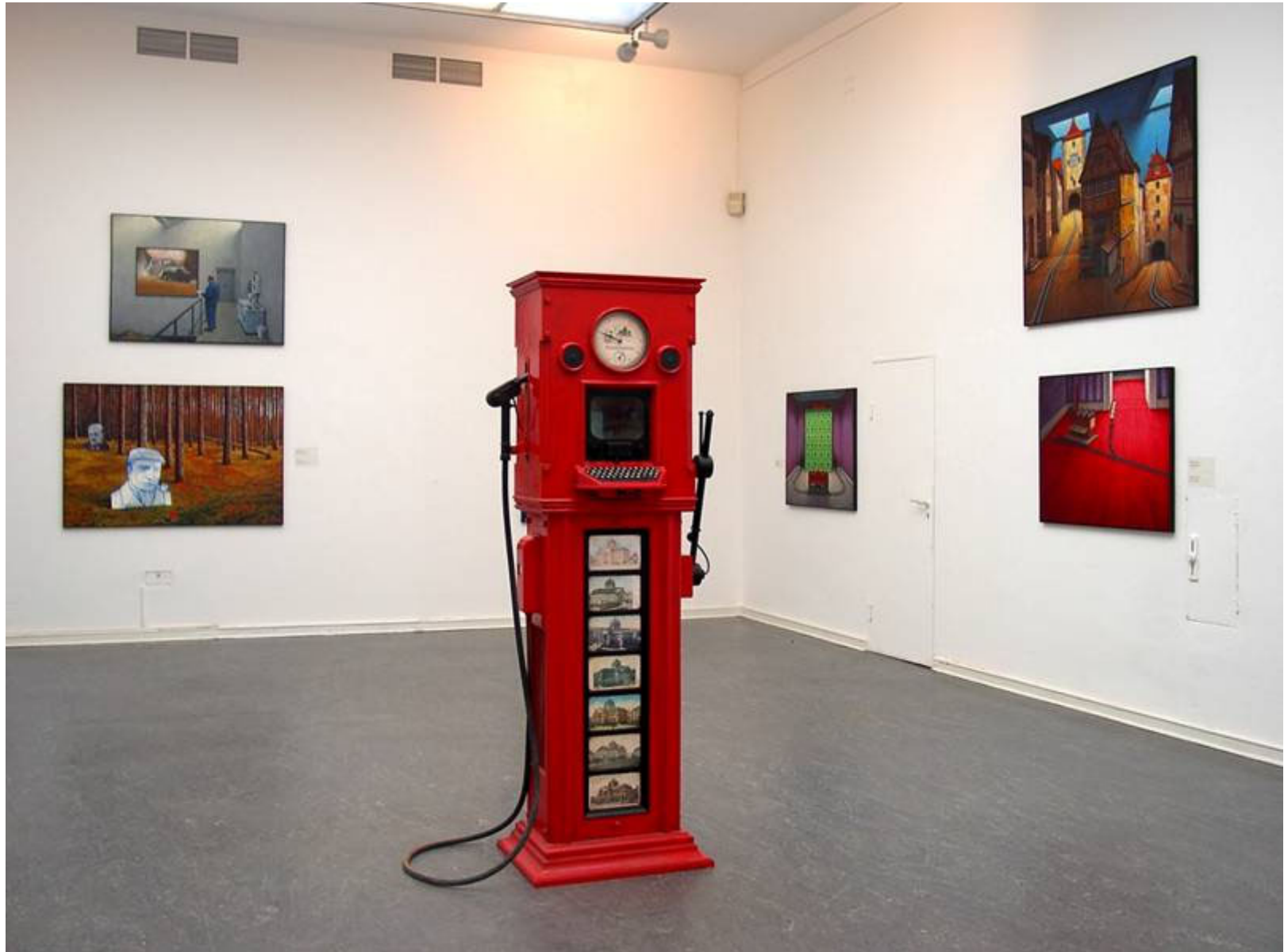
Ruhmstation in der Ruhmeshalle