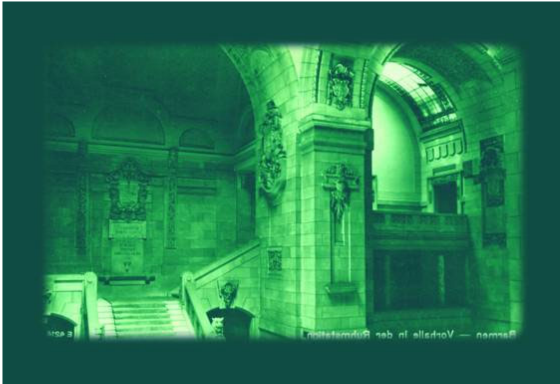
Alte Innenansicht der Ruhmeshalle, nachbearbeitet ( u. a. wurde eine Marmorstatue des Kaisers entfernt ) und im Monitor der Ruhmstation durch einen Spiegeltrick zu sehen.