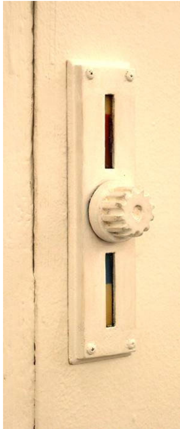
Installation (Barmer Rädchen)