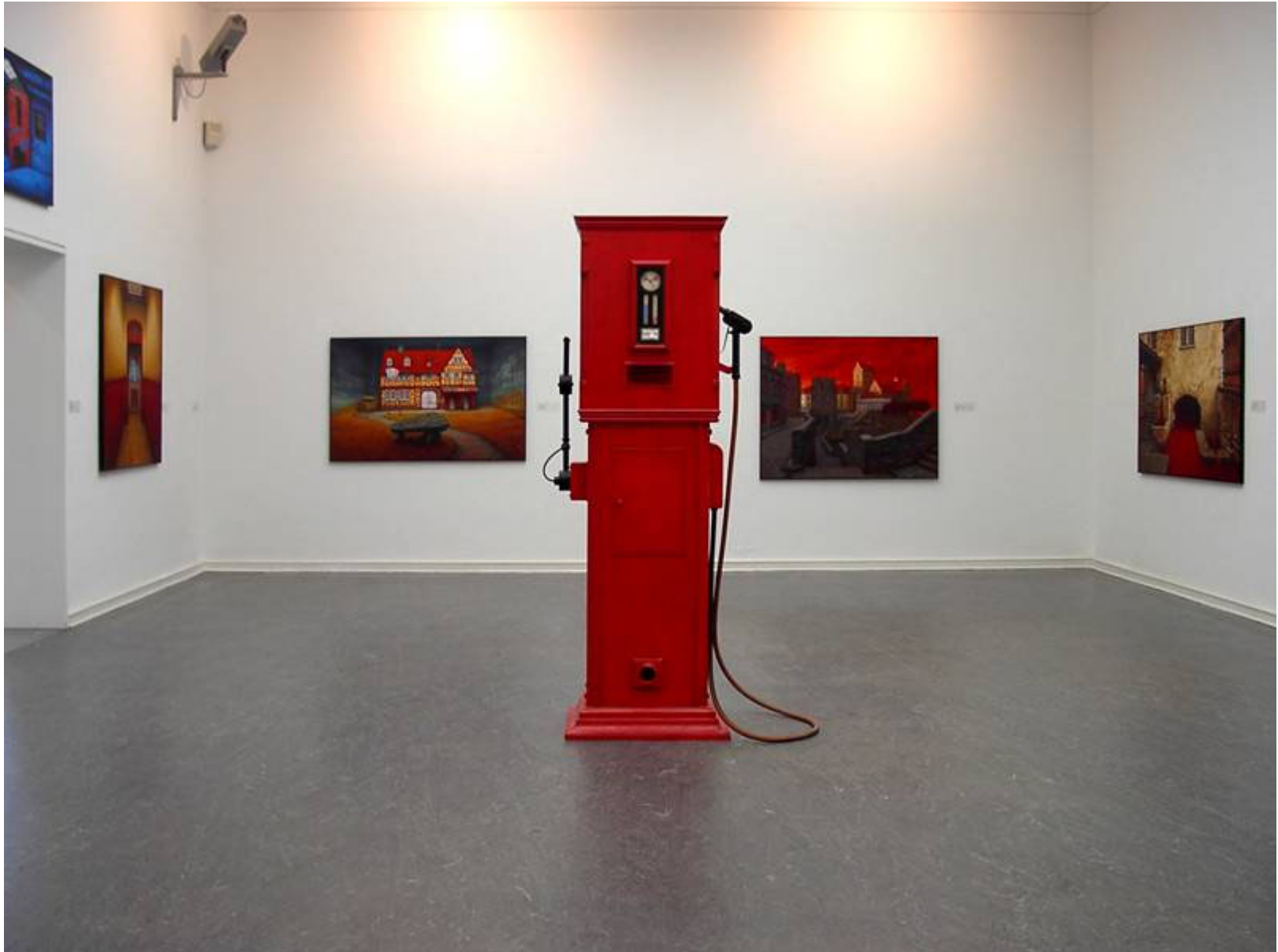
Ruhmstation in der Ruhmeshalle